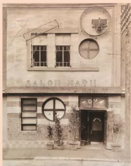
当時の SALON HARU の写真

今回、HARUの時代の菓子づくり への思いを現在の菓子職人が カレーパンとして再現させた。